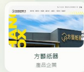
方藝紙器 產品企業