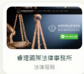
睿理國際法律事務所 法律服務

我們不套用同一種版型，而是依照產業特性、品牌個性與客戶需要，建立適合的視覺語言與網站體驗。