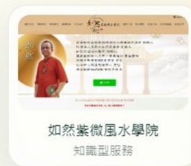
如然紫微風水學院 知識型服務