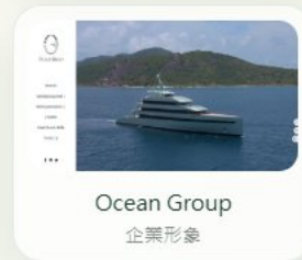
Ocean Group 企業形象