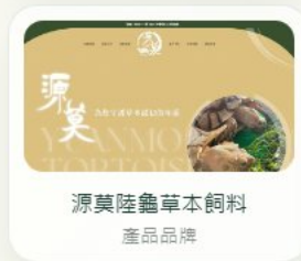
源莫陸龜草本飼料 產品品牌