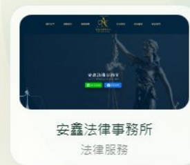
安鑫法律事務所 法律服務