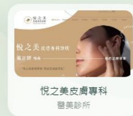
悅之美皮膚專科 醫美診所